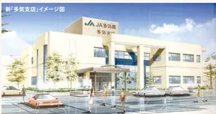
新「多気支店」イメージ図

勢和支店は基幹店(新「多気支店」)の 準基幹店として、多気勢和支店に名称変更されます。