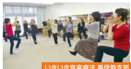
いきいき音楽療法 奥伊勢支部