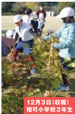
12月3日(収穫) 相可小学校3年生