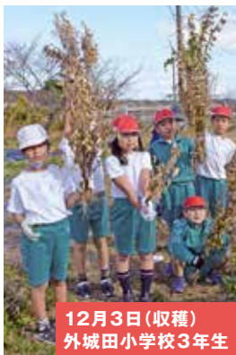
12月3日(収穫) 外城田小学校3年生