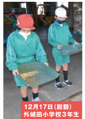
12月17日(脱穀) 外城田小学校3年生

子どもたちは、JA職員や女性部の協力と指導のもと昨年7月に種まきした大豆「フクユタカ」の収穫や脱穀を行いました。大豆を株元から引き抜き、紐で束ねて風通しのいい所にはざ掛けなどして乾燥させました。また、乾燥した大豆をシートに挟んで踏んだり、手作業でさやから取り出しました。殻や大きいゴミをより分け、箕やふるいを使ってカラやゴミと大豆を分けました。また、唐箕にも挑戦し、貴重な体験ができました。