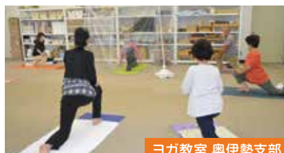
ヨガ教室 奥伊勢支部