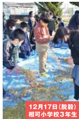
12月17日(脱穀) 相可小学校3年生