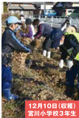
12月10日(収穫) 宮川小学校3年生