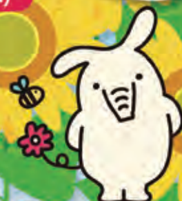
JAバンク新キャラクター よりぞ