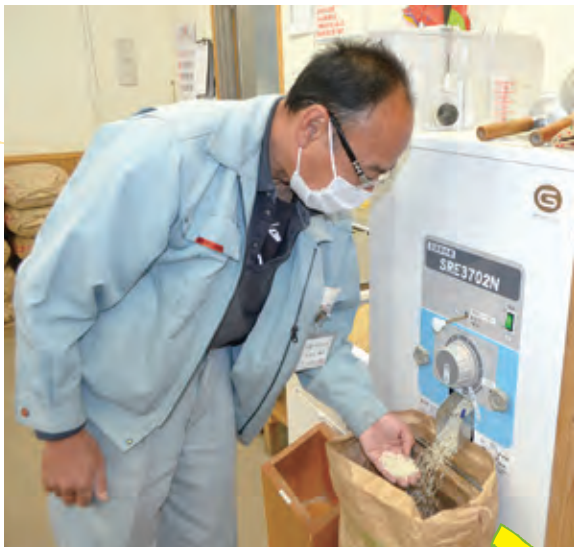
▲精米の状態を確かめます