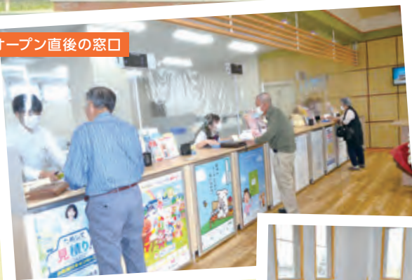
オープン直後の窓口