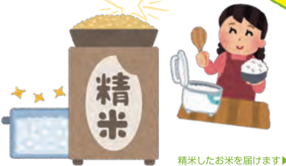
精米したお米を届けます▶

各営農センターでは、自宅で保管している玄米を組合員や利用者に代わって精米する「精米代行」を行っています。高齢者や精米機が近くにない人、重い物が持てない人など支援することを目的に始めました。また、新型コロナウイルスの感染拡大で、外出を控える人にも大変好評です。