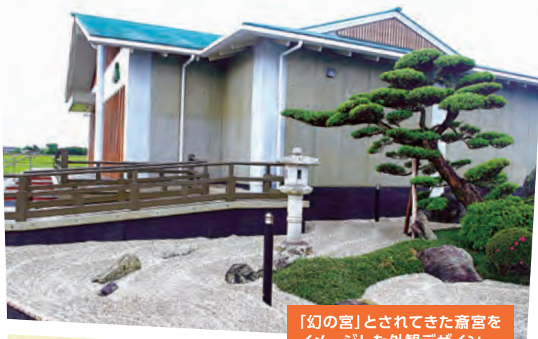
「幻の宮」とされてきた齋宮をイメージした外観デザイン