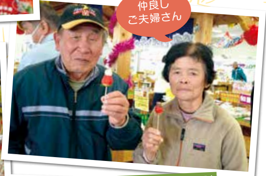
仲良しご夫婦さん