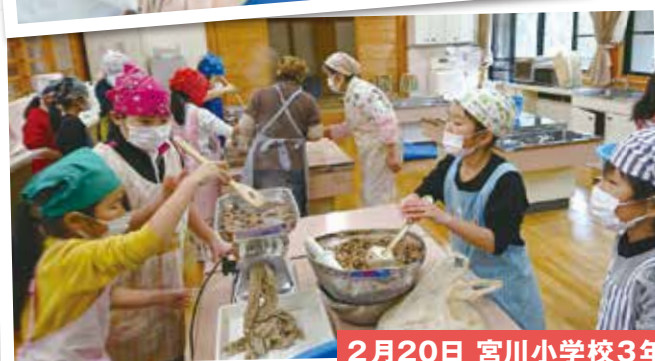
2月20日 宮川小学校3年生