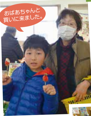
おばあちゃんと買いに来ました。