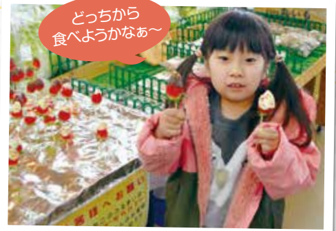
どっちから食べようかなあ〜