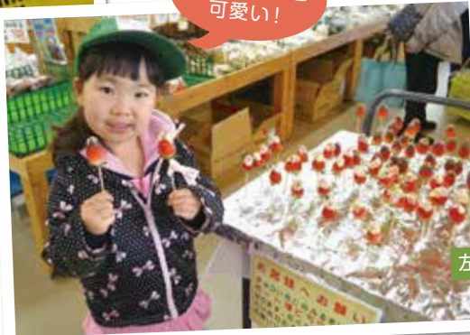
チョコいちご可愛い!