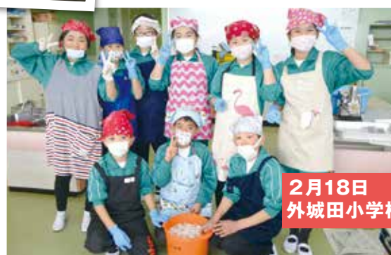
2月18日 外城田小学校4年生