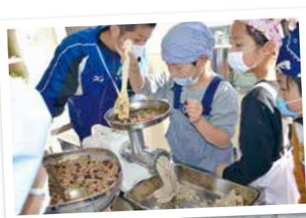
2月13日 日進小学校3年生