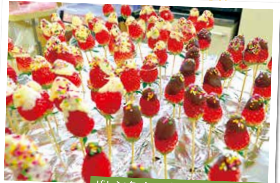
バレンタインに可愛いチョコいちご!

また数量限定で、九州を代表とする福岡県産「あまおう」や桃のような味わいの徳島県産「さくらももいちご」、ほんのり桜色の奈良県産「淡雪」を販売しました。