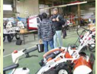
▲2月1日 多気農機センター