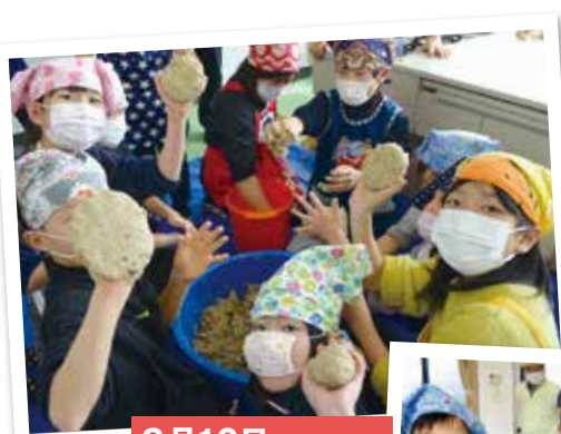
2月10日 川添小学校3年生