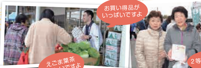
お買い得品が いっぱいですよ