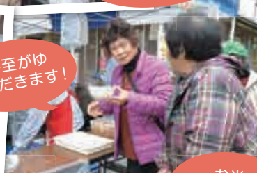
冬至がゆ いただきます!