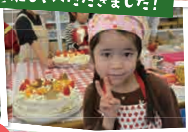
生クリーム、きれいにデコレーション