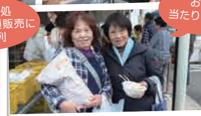
お米 当たりました