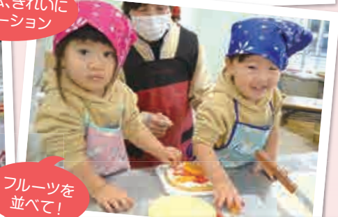
フルーツを並べて！