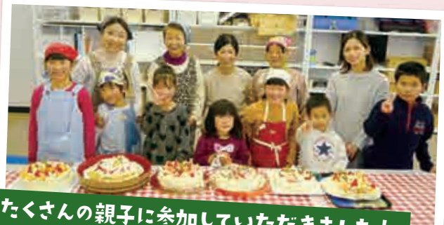
たくさんの親子に参加していただきました！