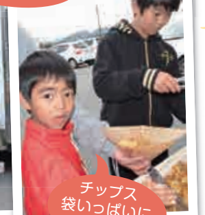
チップス 袋いっぱいにつめるぞ!