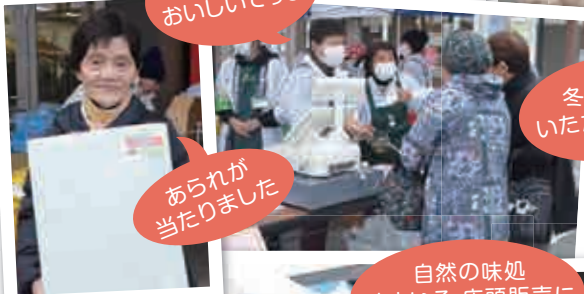
あられが 当たりました