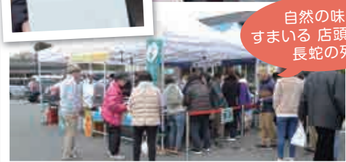
自然の味処 すまいる 店頭販売に 長蛇の列