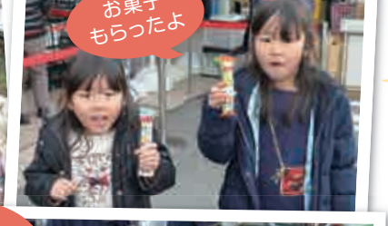
お菓子 もらったよ