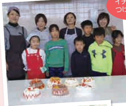
イチゴを飾りつけました♪