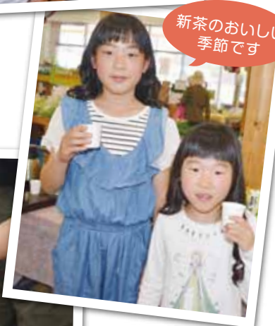
新茶の美味しい季節です