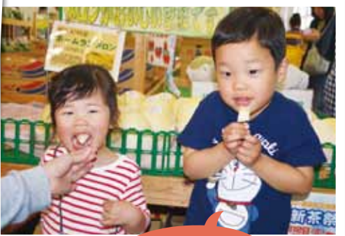
ホームランメロン 甘いね