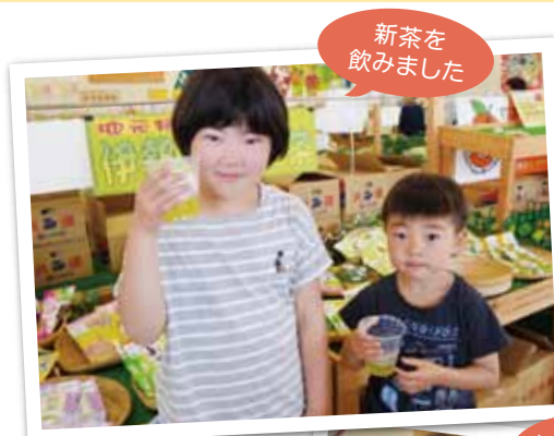
新茶を飲みました

相可支店と佐奈支店の支店長と金融渉外は、直売所でお買い物をすると5%割引になるJAカードのチラシ、また多気営農センターのセンター長と職員は、シロアリ駆除のチラシを手渡して説明しました。