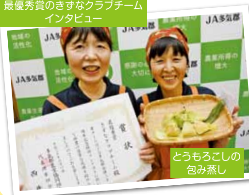
とうもろこしの 包み蒸し