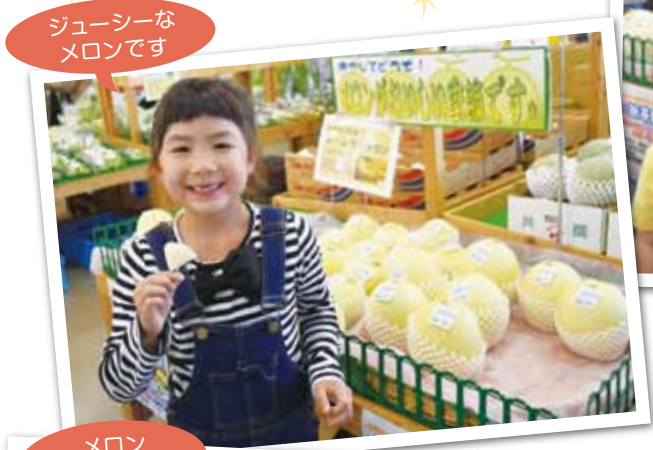
ジューシーなメロンです