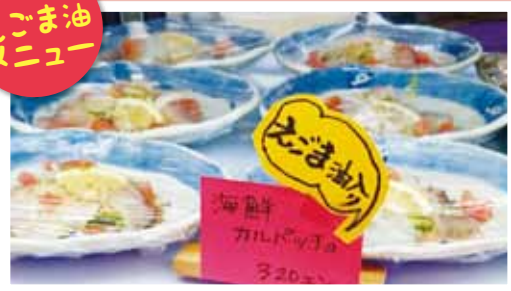
えごま油の海鮮カルパッチョ 320円