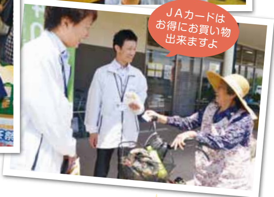
JAカードはお得なお買い物出来ますよ