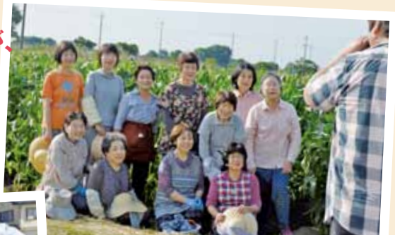
「家の光」取材の様子