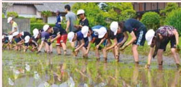
下御糸小学校5年生