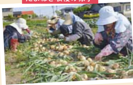
たまねぎ収穫の様子

地産地消を促進するために日々活動している「すこやかクラブ」。その活動に焦点を当てて、学校給食の観点から地産地消を考える誌面です。「すこやかクラブ」の誕生から栽培している野菜の品目や品種、活動方針やこだわりなどメンバーへのインタビューを交えて取材がありました。