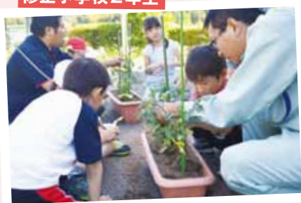
5月10日 修正小学校2年生