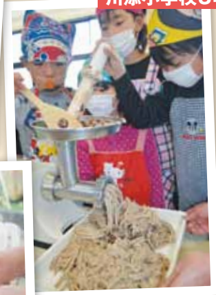
2月16日 川添小学校3年生