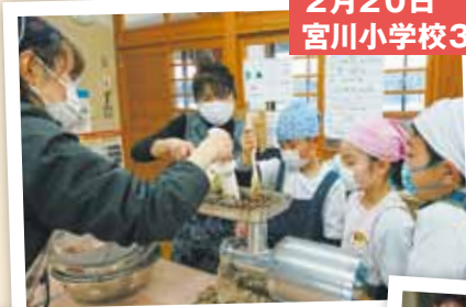
2月20日 宮川小学校3年生