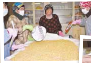
2月15日・16日 勢和地区