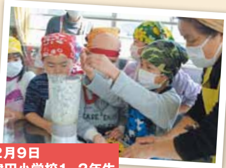
2月9日 津田小学校1、2年生