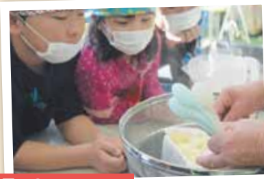
2月16日 川添小学校3年生