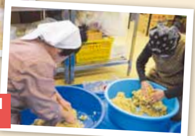
2月6日～3月6日 奥伊勢地区