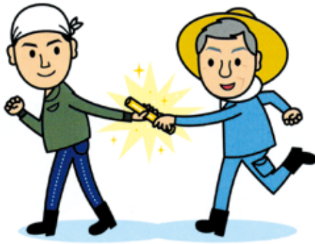
イラスト:ゆきたけし

監修:全国農業協同組合連合会 耕種総合対策部 TAC推進課 https://www.zennoh.or.jp/tac/