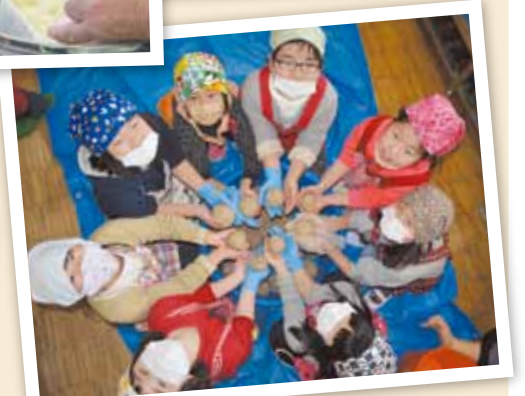
2月21日 三瀬谷小学校3年生