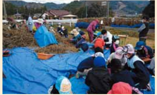
▲川添小学校・三瀬谷小学校