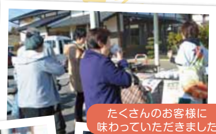
たくさんのお客様に 味わっていただきました

寒い中、お買い物に来ていただいたお客様に温まっていたらごとうと、つくたてお餅入りぜんざいを振る舞いました。店内は、お正月商品を買いたいお客様で大賑わいでした。