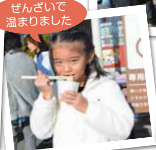
ぜんざいで 温まりました