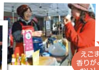
えごま茶、 香りがよくて おいしいわ