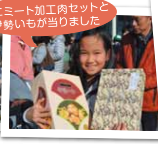
ミエミート加工肉セットと 伊勢いもが当たりました