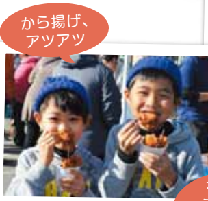
から揚げ、 アツアツ