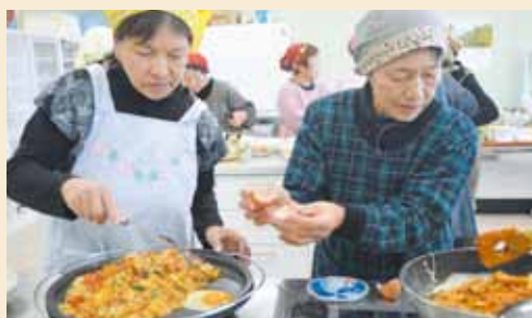
◀冷蔵庫の余り物でもできて、うれしい