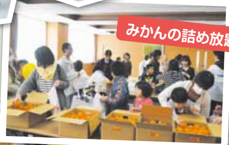
みかんの詰め放題会場