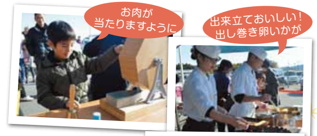
お肉が 当たりますように

周年祭では、自然の味処すまいる羽根料理長らの出し巻き卵店頭販売やミエミートさんのコロックとから揚げの販売、干物や鮮魚の販売、生活指導員の豚汁振る舞い、奥伊勢えごま倶楽部の初搾りえごま油と新商品えごま茶の販売、ガラポン抽選など盛りだくさんの楽しいイベントを行いました。