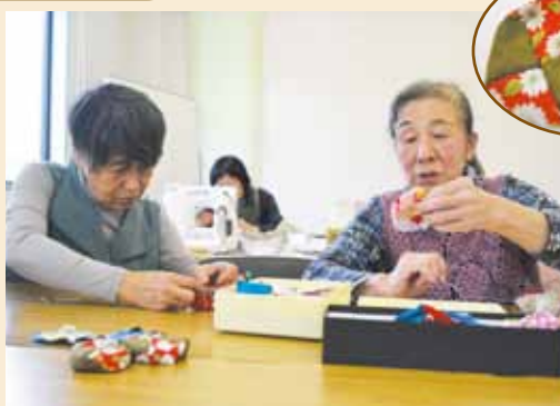
◀かわいいお手玉が出来るわ

お手玉を作りました。手作りしたお手玉の中には、小豆などを入れました。ひんやりした手触り感、ジャリッという音が感覚を刺激して高齢者の認知症予防の効果が期待されると言われています。また、お手玉を通じて世代交流にも役立つと思われます。