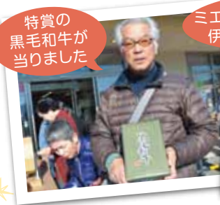
特賞の 黒毛和牛が 当たりました