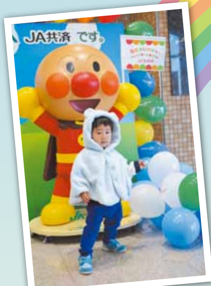
アンパンマンと記念撮影 一緒に撮った写真は、記念のキーホルダーにしてプレゼント!

子育て世代を対象に、地域貢献やファン作りを目的として行いました。クリスマスリース作りやスポーツチャンバラ体験に、同くらぶ会員ら親子17組50人が参加しました。