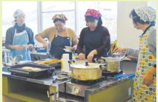
▲▼伊勢いも料理を作りました