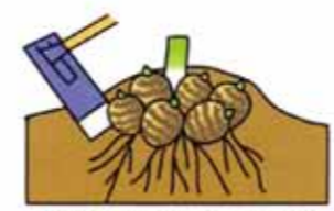
芋が外れたり傷ついたりしないよう注意して掘り上げる