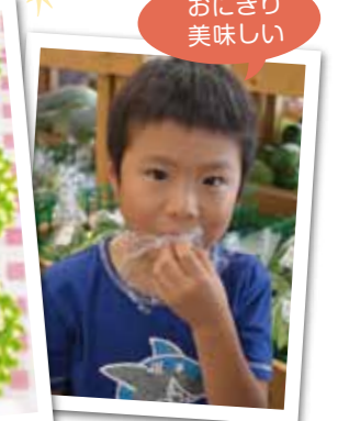
おにぎり 美味しい