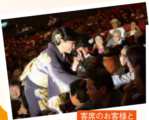
客席のお客様と握手や会話でふれあい