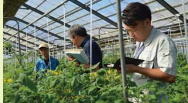
▲ミニトマトの巡回