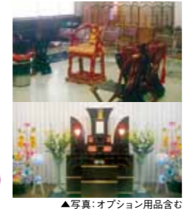
▲写真:オプション用品含む