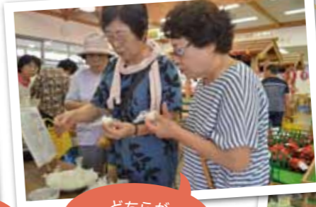
お母さんと来ました