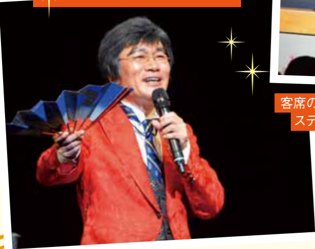
客席のお客様とステージで(二部)