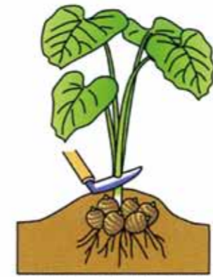
あらかじめ葉と葉柄を切り取り、作業しやすくしておく

サトイモの主成分はでんぷん類、このでんぷんは加熱すると糊化し、消化吸収しやすくなりやす。カリウムは芋類の中では最も多く、高血圧予防に効果的です。タンパク質、ビタミンB群、Cなどを多く含む、栄養価が高いのが特徴、しかも食物繊維も豊富で水分に富み、意外に低カロリー、体重が気になる方にもお勧めです。 秋になって盛んに育ち、芋が肥大したサトイモは、晩秋に入ると育ちが止まり、収穫期を迎えます。収穫適期の目安は、葉の緑が黄化し始め、葉が少し垂れ気味になった頃です。サトイモは寒さに弱く、1〜2回霜を受けただけで葉は容易に枯れてしまいますが、この頃が収穫の限界です。掘り遅れると品質を損ねるだけでなく、