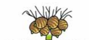
切り口を下に向けて詰め込む