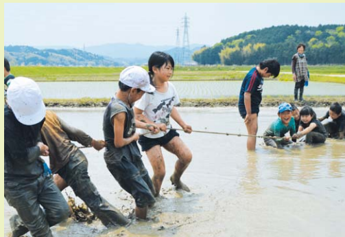
◀ 綱引きをする子どもたち

相可小学校サポート隊田ん田んクラブのみなさんの協力で、田んぼでどろんこ遊びを行いました。はじめて田んぼに入った子どもたちは、その感触に歓声をあげました。みんなで綱引きをしてどろんこになりました。