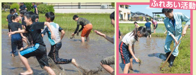
▲楽しく田植えをしました。