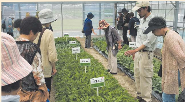
▲研究センターを視察する給食野菜出荷グループ

「すこやかクラブ」と「ベジタブル会」は、(株)サカタのタネ掛川総合研究センターで野菜の特性や栽培ポイントを学び、両部会の親睦を深めました。