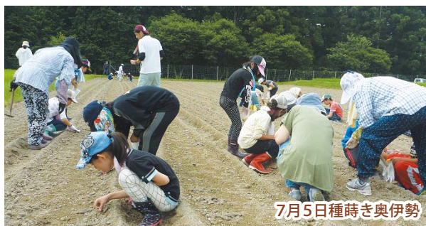
7月5日種蒔き奥伊勢

今号ではこれらが担う様々な活動をご紹介します。なかでも女性部は、年間を通して食農活動に積極的に取り組んでいます。広報誌には、その時期の活動をたくさん取り上げて掲載しておりますが、読者によっては、それぞれが単独での活動と思われているのではないのでしょうか。実は私たちの活動はすべて繋がっています。その繋がりのある食農の活動内容をご紹介します。