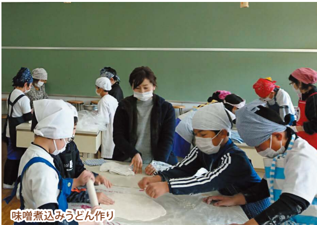
味噌煮込みうどん作り