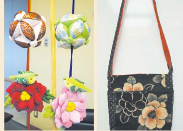
▲ つるし飾り ▲ 着物地のショルダーバック

つるし飾りと着物地のショルダーバックを作りました。鮮やかなちりめんの生地を使って、作っていきます。出来上がりがあるととても楽しみです。