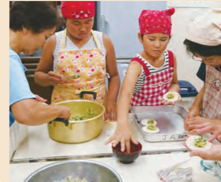
◀子どもたちもみんな真剣につくっていました