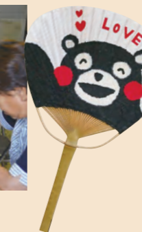
▲クマもの上にオリジナルの LOVE を付けました