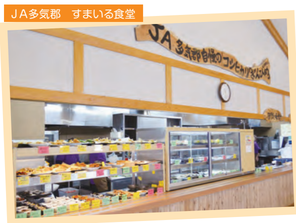
JA多気郡 すまいる食堂

料理バイキング店などのほか、2019年には人気イタリアンシェフとパティシエが手掛けるレストランを含めた大型商業施設の出店も予定されています。 こうした人気店を支える生産者として、多気町大豆部会では高品質の大豆収穫を増やすことが、ついでに地元の食材をレベルアップさせることに繋がるのではとの想いから、日々実直に生産・研究に取り組まれています。 JA多気郡でも、他の生産者部会とも連携を図りながら様々な高品質の食材を提供できるように取り組んでいます。