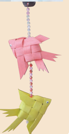
かわいいエンゼルフィッシュ完成!!

助け合い組織にじの会の協力で、テープのかわいいエンゼルフィッシュを作りました。ビーズをつけたり、風鈴をつけると涼しげになります。