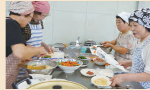
◀野菜をたくさん摂ることができました。