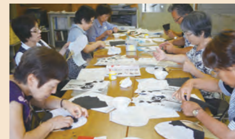
◀男性も参加し、みんなで楽しく作りました