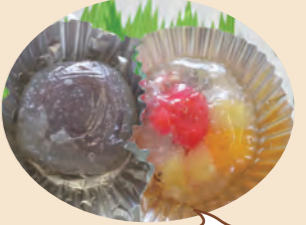
おいしい葛まんじゅう完成!!

餡とフルーツの2種類の葛まんじゅうを作りました。餡は新予約共同購入の餡です。透明で涼しそうな和菓子ができました。