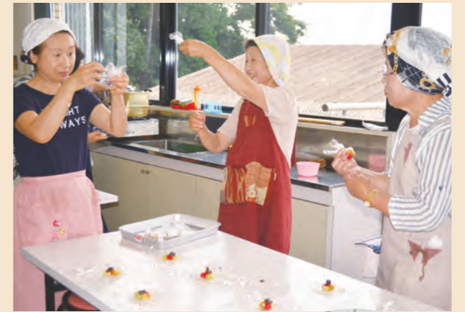
▲葛でフルーツを包んでいます

餡とフルーツの2種類の葛まんじゅうを作りました。餡は新予約共同購入の餡です。透明で涼しそうな和菓子ができました。