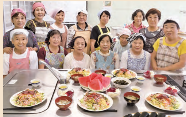
▲完成を喜びみなさん

助け合い組織にじの会の協力で、収穫したばかりの新米でちらし寿司と海苔巻きを作りました。