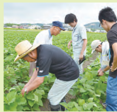
▲ほ場巡回で実際に大豆を見る生産者

実際に大豆ほ場に出向き、生長具合や、害虫の有無を確認し、翌日には防除を行いました。