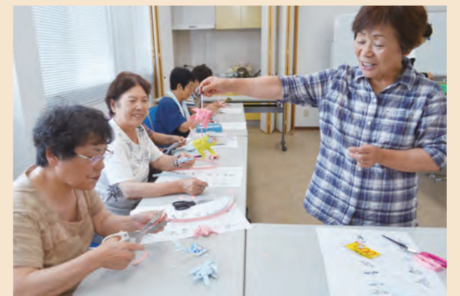
▲楽しく作りました

助け合い組織にじの会の協力で、テープのかわいいエンゼルフィッシュを作りました。ビーズをつけたり、風鈴をつけると涼しげになります。