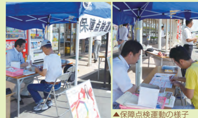
▲保障点検運動の様子

「これをきっかけにもしものときの防災意識をもってもらい、すばらしい保障のあるJA共済があることを知ってもらいたい」と両支店長は話しました。