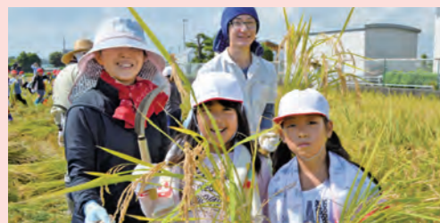
◀子どもたちと一緒に稲刈り ▼子どもたちと一緒に脱穀体験

むらおこしかみみいとの人たちや子どもたちと楽しく初体験! 稲刈りをし、脱穀をしました。