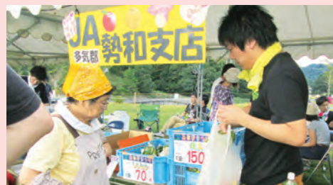
◀野菜・果物、ヨーヨーの出店、販売をしました。