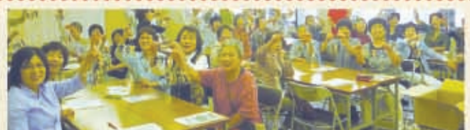
33名が視察に見えました。助け合い組織にじの会のメンバーが指導し、手芸をして交流を深めました。