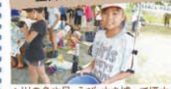
▲川の魚や貝、えび、虫を捕って標本をみながら名前を調べました

むらおこしかみみいとの方々の指導で子どもたちは川の水を調べました。「きれいな水は「きれい」と判断しました。毎日食べる美味しいお米はこの川の水を使います。きれいな水を使えば、おいしいお米が育ちます。きれいな水を大切にしたい」と話しました。