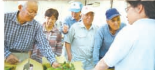
▲サンプルのスイートコーンをみて大きさの規格や実の出来具合を見ました

スイートコーンの生産者が参加し、出荷規格を確認しました。今年も甘い品種の「味甘ちゃん」が主流で上々の出来具合です。