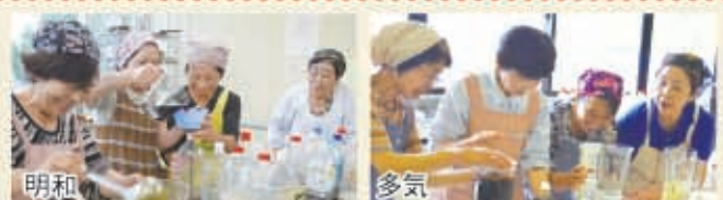
花かつお・昆布を使って万能つゆ、にんにく・いりごま・赤味噌などを使って焼肉のたれをつくりました。