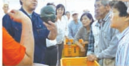
▲市場関係者の説明を聞く生産者

参加した多気郡内の生産者は、サンプルのカボチャを手にし、大きさや熟度を確認しました。野菜は新鮮さが一番ですが、カボチャは新鮮なものより、収穫日から10日ほど経ったものが美味しいそうです。