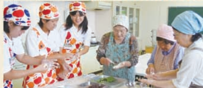
▲生地伸ばし方や餡子の包み方を教えました 作業はとても楽しく、きれいに出来上がりました。