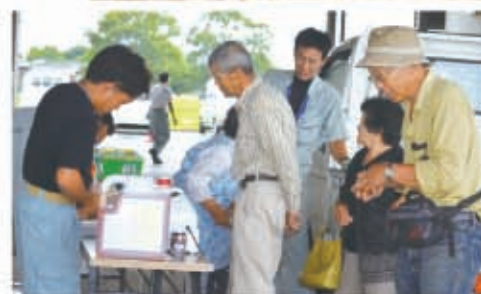
▲農業や肥料購入の受付の様子

肥料・農薬が特別価格で販売され、新大型農機、小物農機具、自動車もたくさん展示しました。