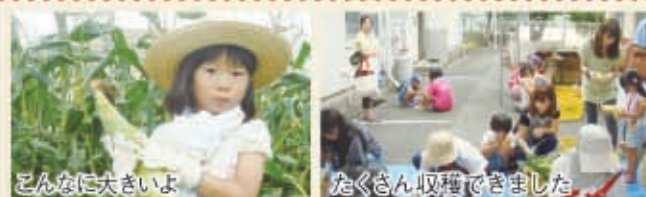
親子参加者17組と女性部員16人、野菜ソムリエ4人が参加し、とうもろこし収穫体験、はがまではん炊き、とうもろこしのアイスクリーム作り、野菜ピンゴをして楽しみました。昼食にはとうもろこしご飯のおにぎりを食べ、野菜ソムリエの方のお話を聞きました。