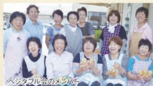
ベジタブル会のメンバー