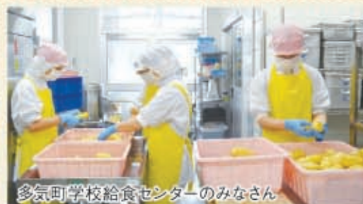
多気町学校給食センターのみなさん

2月に結成した学校給食用野菜栽培グループのベジタブル会が、多気町の小中学生の給食用に初めてジャガイモを提供しました。これからはいろいろな野菜作りに挑戦しようとなみなさん意欲満々です。