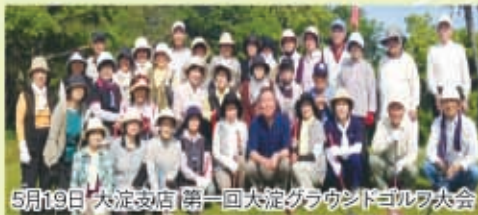
5月19日 大淀支店 第一回大淀グラウンドゴルフ大会