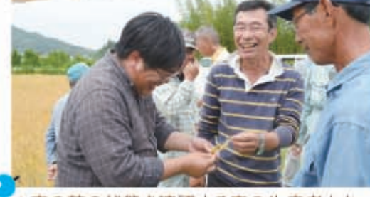
▲麦の穂の状態を確認する麦の生産者たち