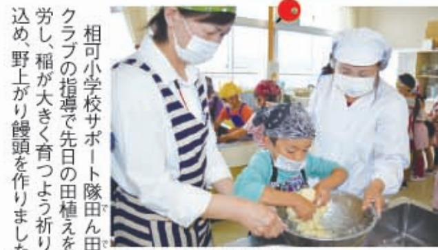
▲一生懸命作りました

相可小学校サポーター隊田んぼクラブの指導で先日の田植えを慰め、稲が大きく育つよう祈りを込め、野上がり饅頭を作りました。