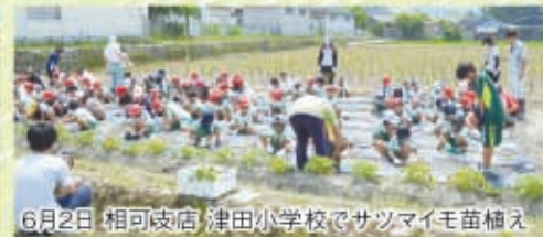
6月2日 相可支店 津田小学校でサツマイモ苗植え