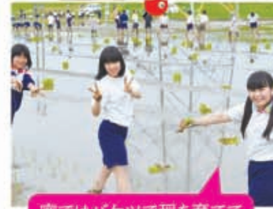
▲家でバケツで稲を育てています。農業大好き!

東京の開進第二中学校3年生129人が修学旅行で自然体験を目的に多気町兄国の田んぼで田植えを行いました。西川浩さん、田んぼクラブ、朝長・兄国の農家のみなさんに指導していただきました。