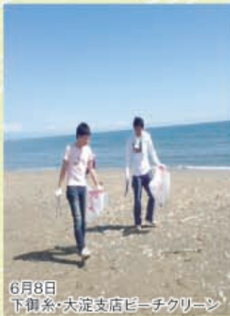
6月8日 下御糸・大淀支店ビーチクリーン