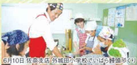
6月10日 佐奈支店 外城田小学校でいばら饅頭づくり