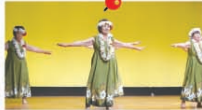
▲フラダンスを披露する会員

JAで年金を受け取っている多気地区の方を対象に開催しました。松阪警察署生活安全課の職員から振り込め詐欺の防止策の話の後、フラダンスや手品、歌、踊りを観て楽しみました。