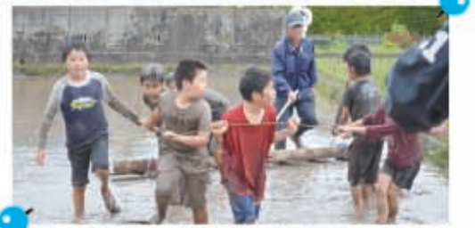
▲草が生えていた田んぼは田植えが出来るように綺麗になりました

むらおこしみょうじょうの方たちの指導で代かきをしました。先生も子どもたちも全身使って代かきを行いました。