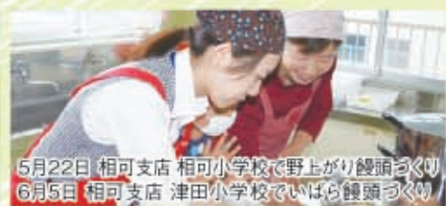
5月22日 相可支店 相可小学校で野上がり饅頭づくり 6月5日 相可支店 津田小学校でいばら饅頭づくり