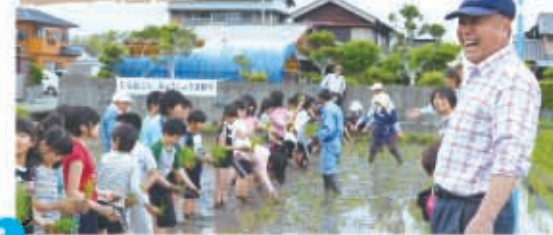
▲むらおこしみょうじょうの方たちに見守られ田植えをする子どもたち