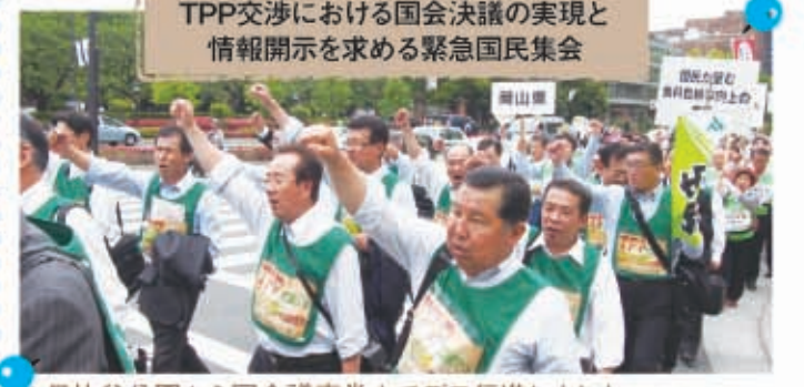
▲日比谷公園から国会議事堂までデモ行進しました