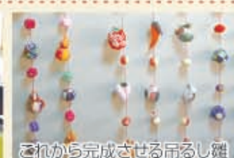
これから完成させる吊るし雛